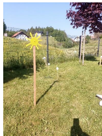
Sončna ura na igrišču