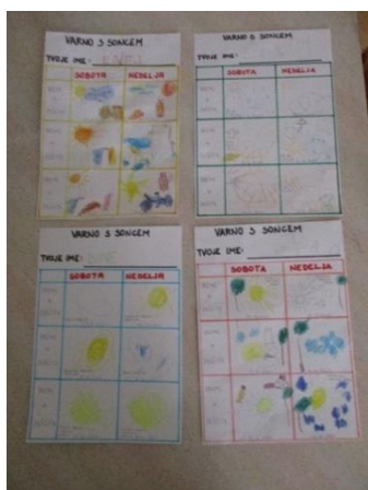
Beleženje vremena čez vikend