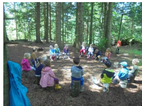
Zadrževanje v senci