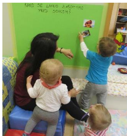
Plakat Kako se zaščitimo pred soncem?