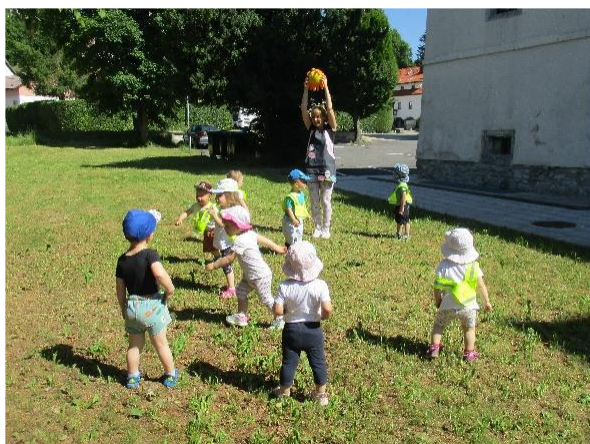
Gibalna igra Skrijmo se pred nevarnimi sončnimi žarki