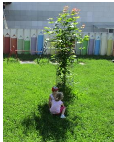
Gibalna igra Sveti, sveti sonce ; otroci najdejo različne sence.