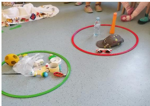
Kaj sodi oz. ne sodi skupaj