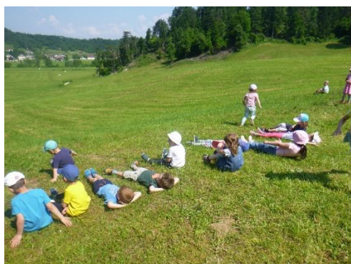
Igra Kam izgine senca, če se uležem