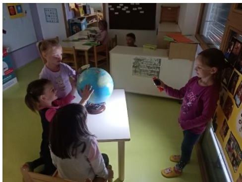
Spoznavanje zakaj imamo noč in dan