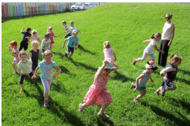
Gibalna igra Sveti, sveti sonce ; otroci iščejo senco.