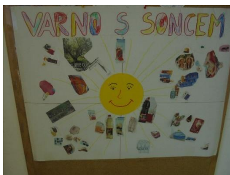
Izdelava plakata Varno s soncem