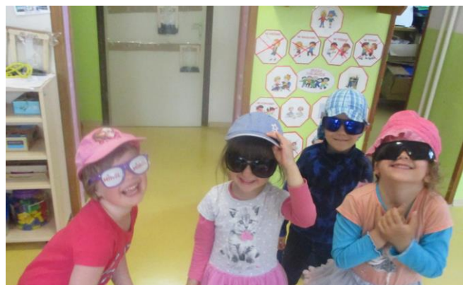
Zaščita pred sončnim sevanjem