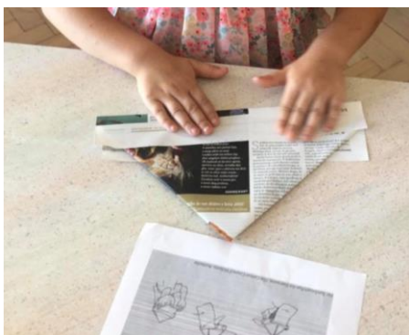
Izdelovanje legionarske kape