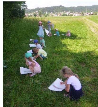
Risanje v senci dreves