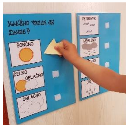
Beleženje vremena v igralnici