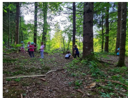
Zadrževanje v senci