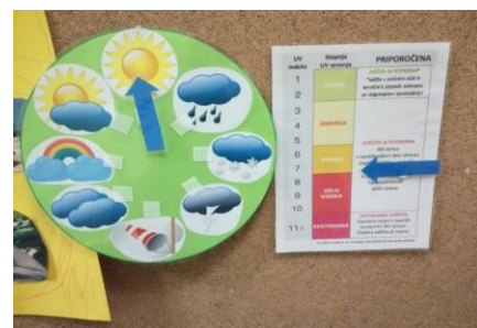
Beleženje vremena in spremljanje UV indeksa