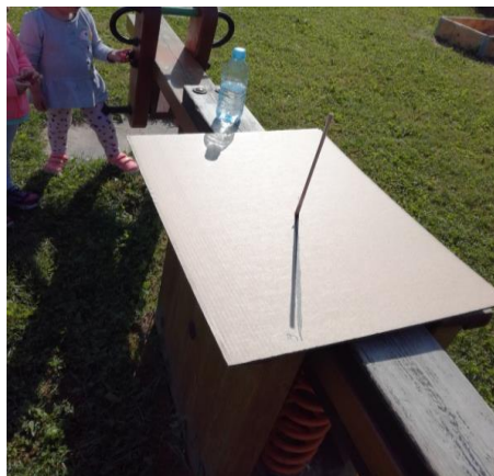
Sončna ura in poskus z dvema plastenkama