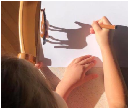
Obrisovanje senc plastičnih živali