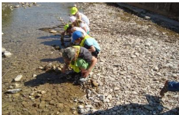
Igre z vodo (skupina Gosenice)