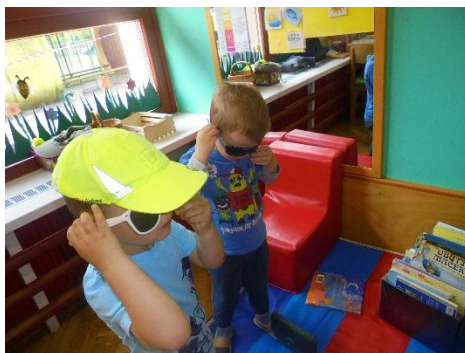
Kotiček Varno s soncem