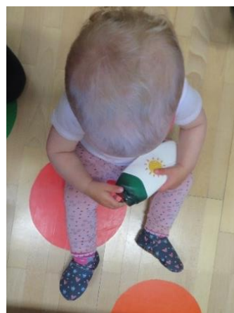
Igra s pripomočki za zaščito pred soncem