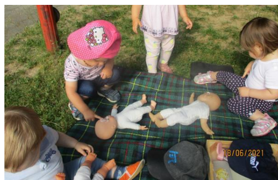
Zaščita pred soncem