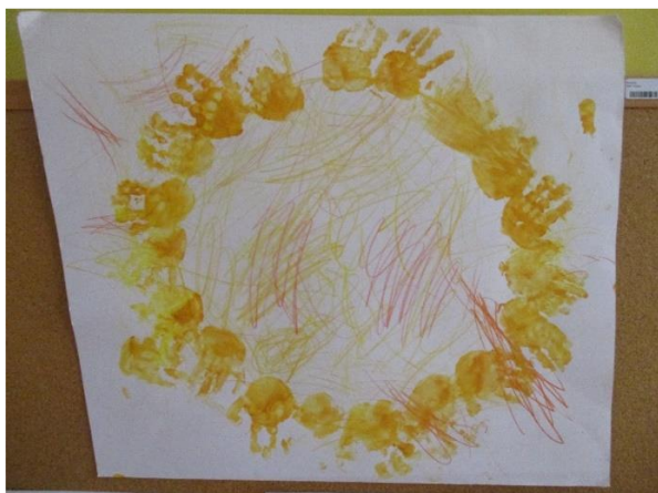
Obležitev dneva Sonca