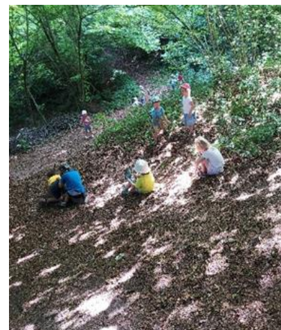
Igra v senci